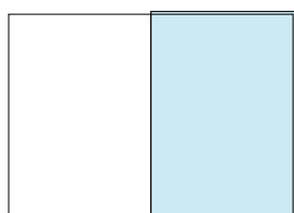
Una página: 225 x 320mm. (228 x 326mm. con sangre incluida)